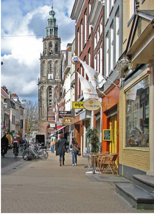
Figur 6: Utsnitt fra sentrumsgate i Groningen. Bredden på fortauene gir altså mulighet for ulike bruk og aktiviteter som stimulerer byliv. Selv om løsningene i Groningen sentrum og i Kvadraturen ikke er helt sammenlignbare, illustrerer bildet hvordan fortauet bidrar til utfoldelse av byliv og gode opplevelser for byens brukere og kunder. Dette vil være viktig for handelsstanden.