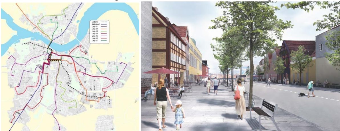
Figur 1: Kart over busslinjenettet i Aalborg og illustrasjon av ny gateutforming ved Nytorv

BRT (Bus Rapid Transit) er en miljøvennlig høyklasse bussforbindelse, som gir kortere reisetid og skal skape større sammenhenger mellom transport og byutvikling. Aalborg Kommune vil bruke BRT som en drivkraft for byutviklingen samtidig som den skal løse byens konkrete trafikutfordringer. I Aalborg er BRT oversatt til Plussbuss . Totalstrekning er på 12 km fra Væddeløbsbanen gjennom midtbyen til Aalborg Universitetshospital.