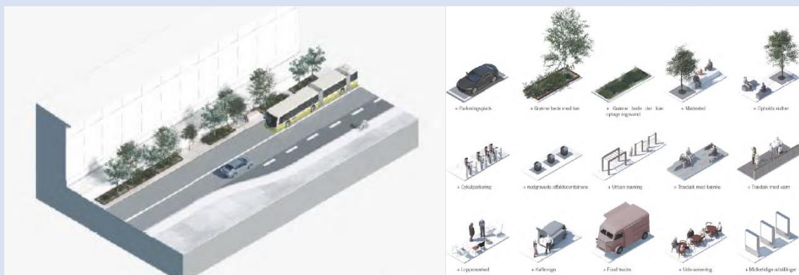
Figur 2: Illustrasjon av flexiarealet i Kastevej i Aalborg. Kastevej er bare 1-2 meter bredere enn gatene i Kvadraturen, og derfor et relevant eksempel.

Flere gater er breiere enn i Kvadraturen. Løsninger for Kastevej (rundt 15-16 meter bredde på store deler av strekningen) kan være til inspirasjon der bruk av flexareal kan vurderes i bussgatene i Kvadraturen for å bidra til grønne og aktive bussgater rundt og mellom busstoppene. Flexarealer er også aktuelle for å løse varelevering, møblering av gata med benker eller uteservering, sykkelparkering, beplantning, mm. Parkvesenet jobber allerede med et slikt konsept for opprusning av Kirkegata mellom Gyldensløvesgate og Tordenskjoldsgate.