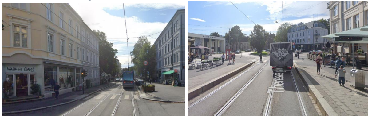
Figur 4: Google Streetview fra Thereses gate ved Bislett i Oslo. Gatebredde er ca. 15,4 meter.

Et eksempel fra Oslo som kan være relevant for Kristiansand er oppgraderingen av Thereses gate fra Bislett til Adamstuen. Selv om gaten betjenes med trikk, er den